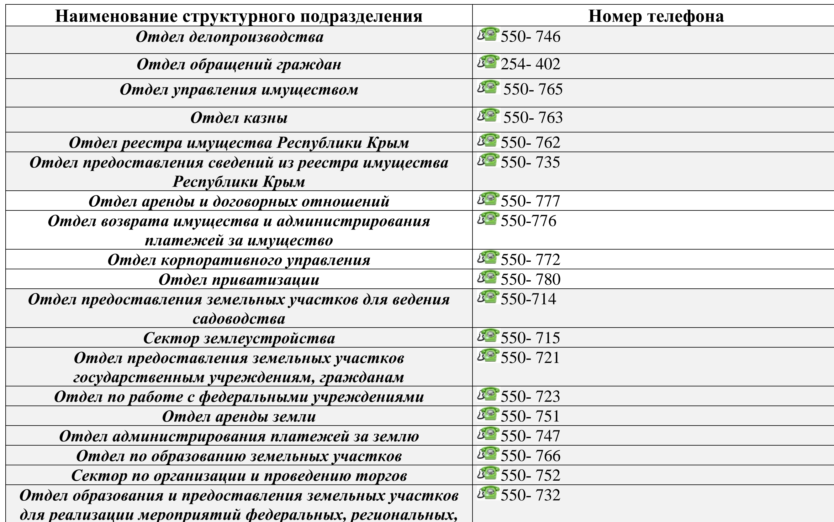
График приёма граждан структурными подразделениями Министерства имущественных и земельных отношений Республики Крым